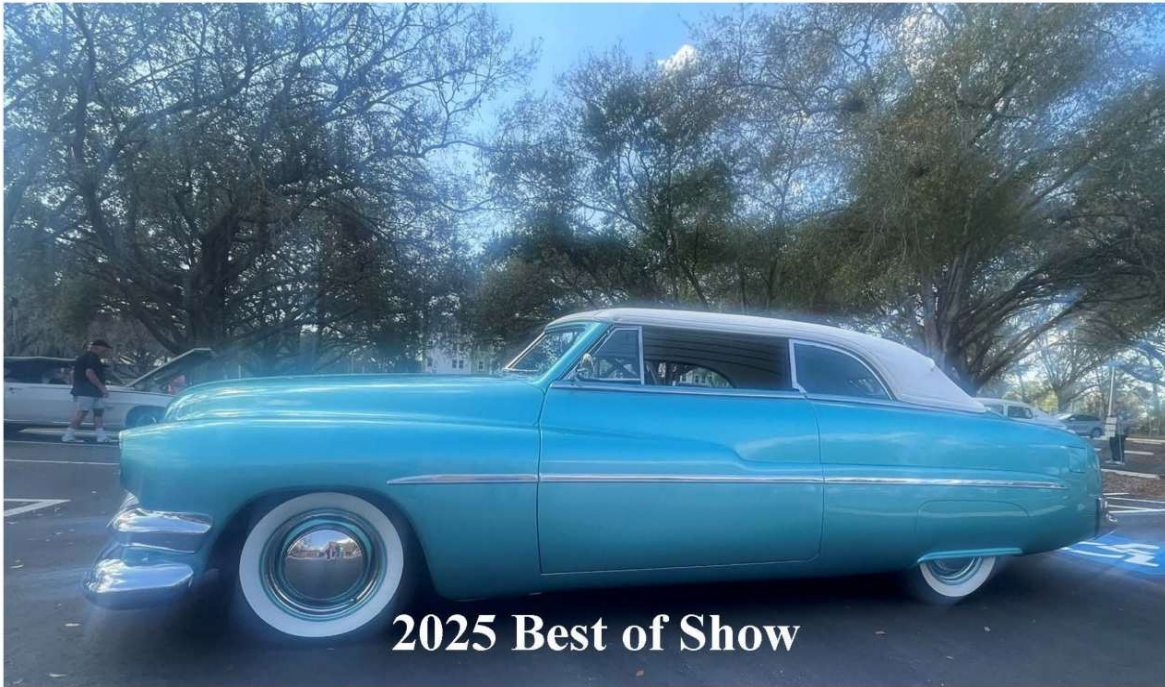
2025 Best of Show

February 7, 2026 / 9:00 a.m. ~ 3:00 p.m.